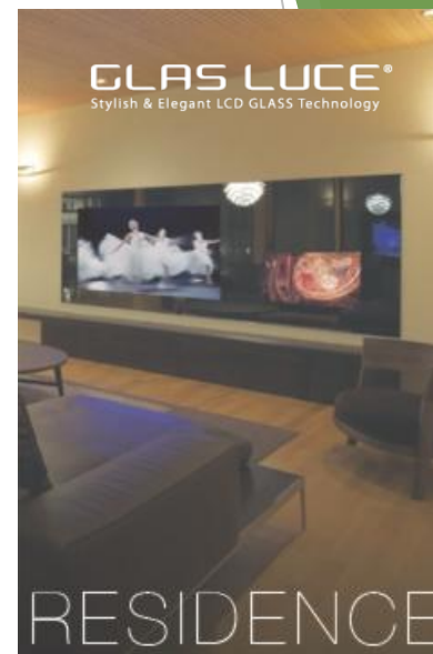
ミラーガラス「グラスルーチェ」

確かに人口で言えば、富裕層といわれる方たちの割合は2%弱とわずかなものですが、純金融資産総額は全体の20%を占める市場規模にして200兆円を超える金融資産が眠っている市場で大きなビジネスのチャンスと言えます。