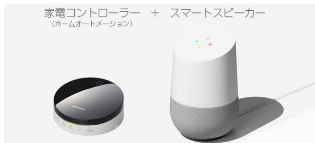
AIスピーカーとの連動

OK Google, エアコンつけて！ リビングの気温の調整も「エアコンつけて」と声かけるだけ。部屋の居心地もあなたの声でコントロールできます。