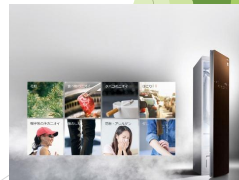
ライフスタイルクローゼット スチームウォッシュ&ドライ 「LG stlyer」