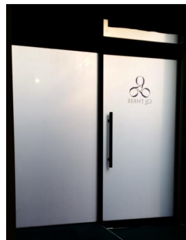
瞬間調光フィルム

そして、このデジタルサイネージの映像を映し出すためのプロジェクター用スクリーンとしても瞬間調光フィルムを大いに活用できます。