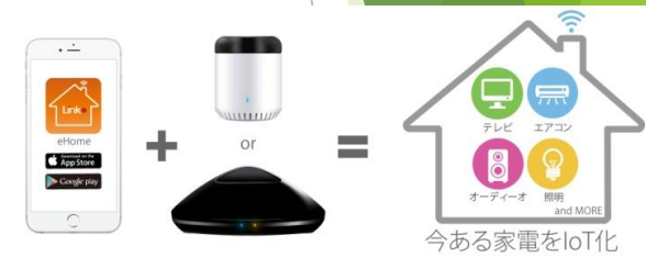
スマホでコントロール