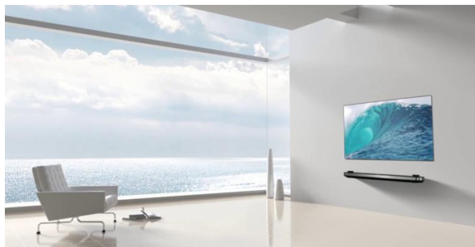
LGエレクトロニクス最高峰のプレミアムブランド「LG SIGNATURE」