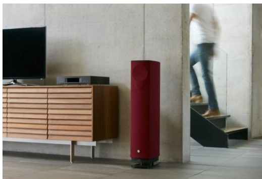
イギリス王室御用達のハイエンド総合オーディオメーカー「LINN」